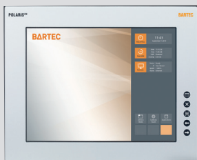
POLARIS Remote ZeroClient 19.1"