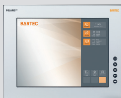
POLARIS Remote ZeroClient 15" Sunlight