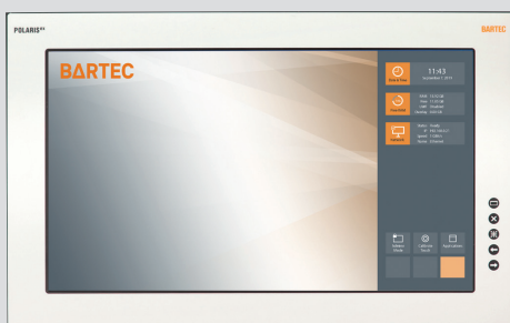
POLARIS Remote ZeroClient 24" W