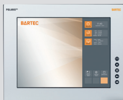
POLARIS Remote ZeroClient 15"