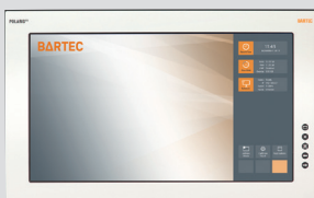
POLARIS Remote ZeroClient 17.3" W